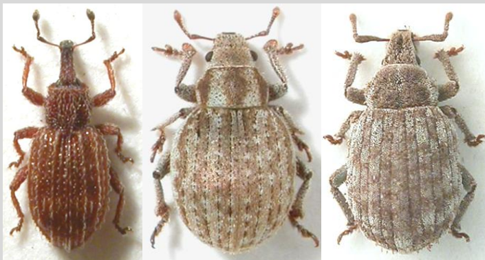
Orthochaetes insignis (2,2)