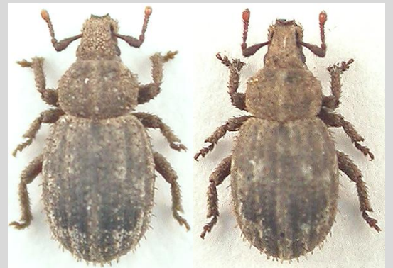
Trachyploeus rectus Thomson, 1865 (*?) (2,5)

Peu citée, cette espèce méridionale se rencontre toute l'année, du bord de mer à 2600 m. d'altitude.