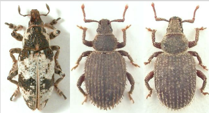
Bothynoderes affinis (10)